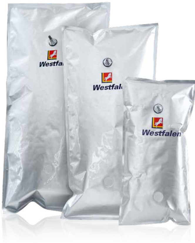
Alumini® 1-Kleingebinde in den Größen 28 l, 15 l und 5 l.