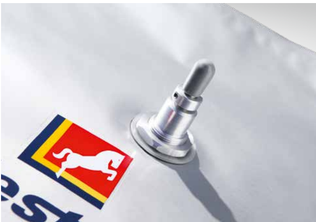
Direktanschluss mit integriertem Ventil: Schlauch mit 6 mm Innendurchmesser fixieren, kontrollierten Gasfluss durch Ventildrehung aktivieren.