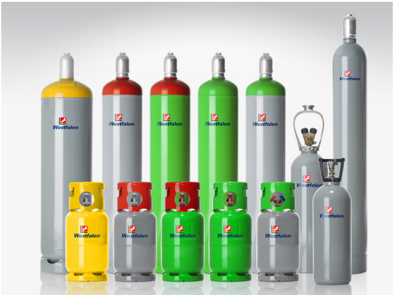
Das Kältemittelflaschen-Sortiment von Westfalen.

Weitere Informationen unter westfalen.com